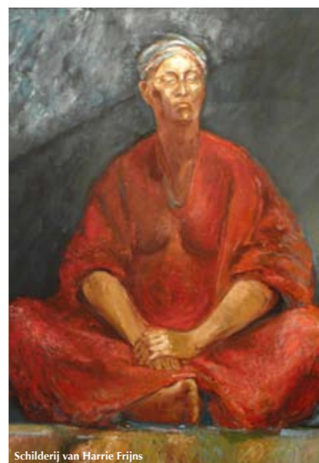
Schilderij van Harrie Frijns